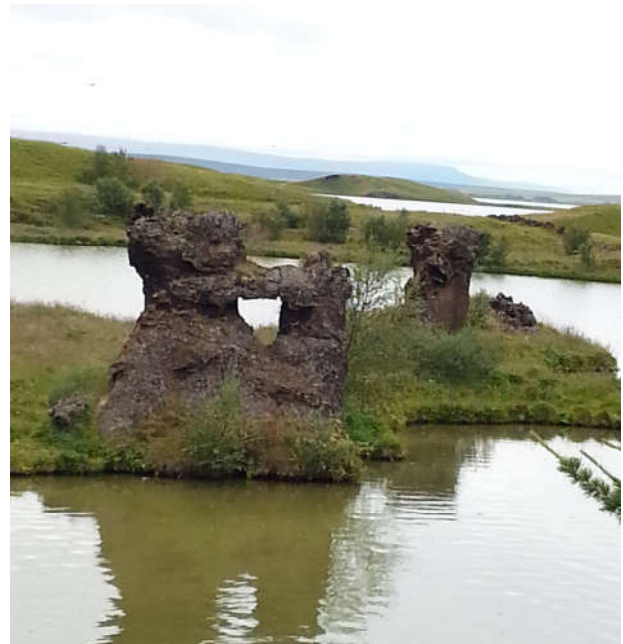
In der Nähe von Myvattn